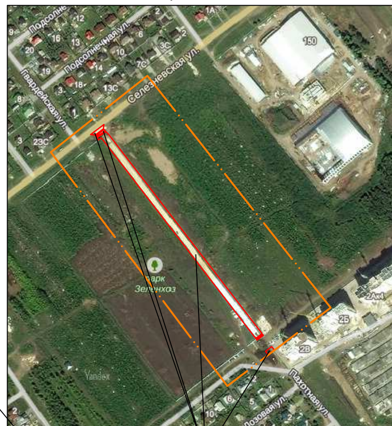
Место расположения объекта