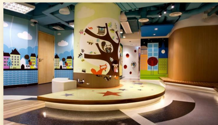
Образовательные холлы (галереи творческих проектов, интерактивные музеи, выставки-вернисажи)