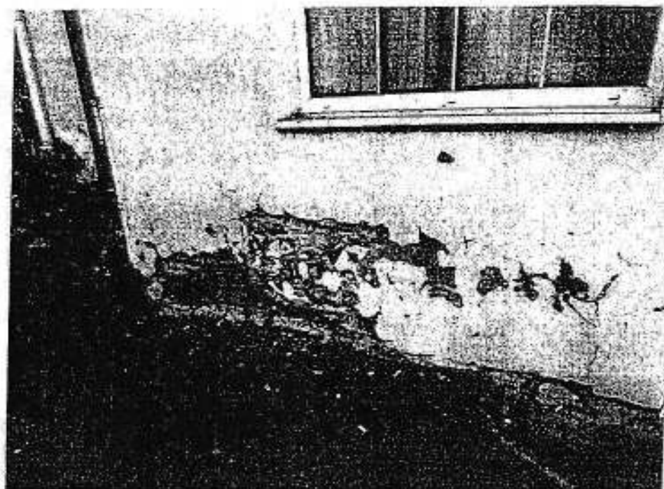
фото 1. Разрушение штукатурки покорельных участков

Приложение к акту осмотра фасадов выявленного объекта культурного наследия от 22 октября 2018 г. «Кинотеатр «Родина», г. Тамбов, ул. Интернациональная, 26