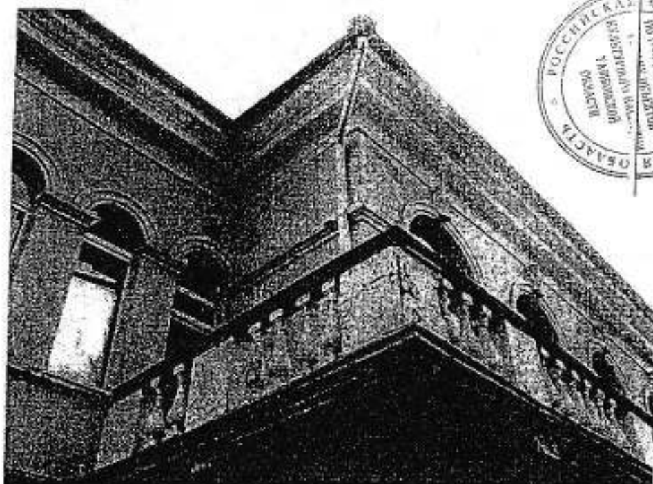
фото 3. Левый боковой фасад - балкон